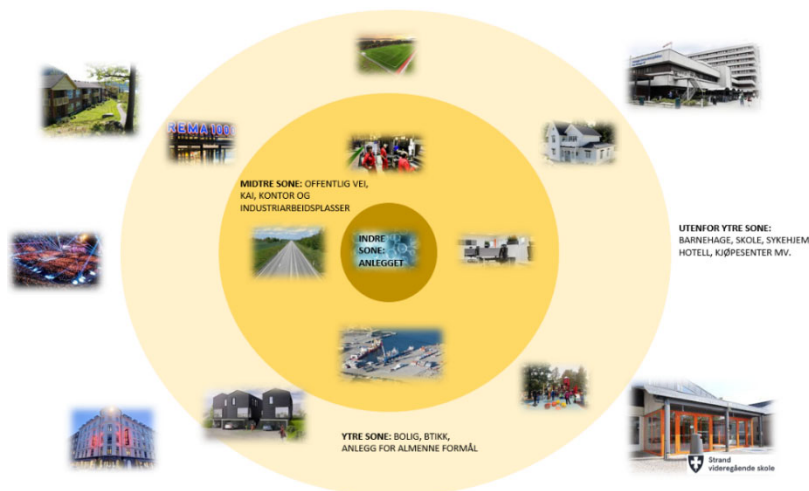
Figur 2 Illustrasjon som viser kva som er tillate i dei ulike omsynssonene.